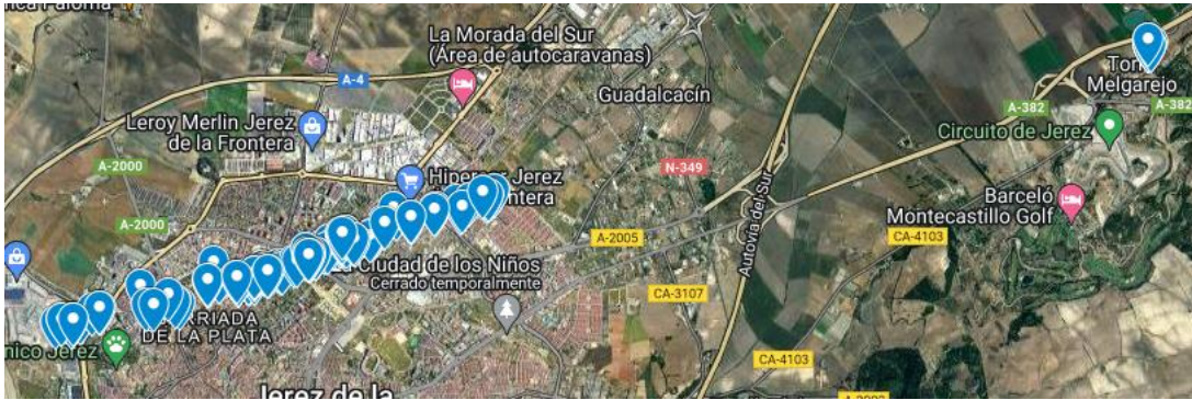
Daños inspeccionados en Jerez

La visita permite confirmar el paso de uno o dos tornados por la zona de estudio durante la madrugada del día 14, aproximadamente a las 2:15 en Rota y 2:30 – 3:00 en Jerez. Las franjas afectadas irían desde los pinares de Rota hasta las instalaciones de la Base y en Jerez desde el centro comercial Área Sur hasta la pedanía de Torre Melgarejo, con una anchura máxima de unos 100 m. A falta de un análisis más detallado, los daños más graves podrían alcanzar la categoría de EF2 en la escala mejorada de Fujita